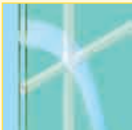
Sprosse im Scheiben- zwischenraum (Breiten: 18 mm, 26 mm und 45 mm*)

Die echte Sprosse stellt die aufwendigste Form der Sprossentypen dar. Hierbei wird das Fenster konstruktiv unterteilt und in einzelne, separat verglaste Felder gegliedert.