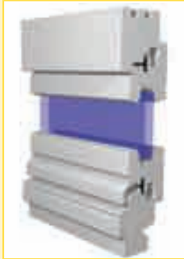
Typ IV 68 Standard