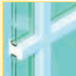
Echte Sprosse (Standardbreiten: 48 mm, 78 mm und 130 mm*)