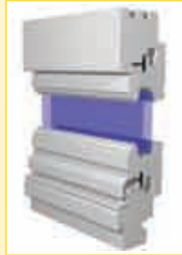
Typ IV 68 Standard profiliert