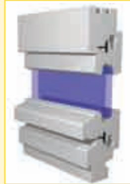
Typ IV 68 Denkmal