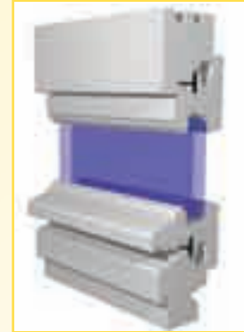
Typ IV 68 Denkmal profiliert