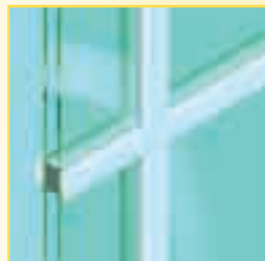
Aufgesetzte Sprosse (Standardbreiten: 22 mm, 30 mm und 45 mm*)